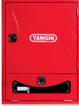
3- DEKORATİF SAC KAPAK DECORATIVE SHEET COVER