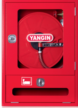
2- CAMLI KAPAK / GLASS COVER