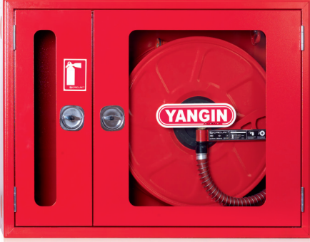
2- CAMLI KAPAK / GLASS COVER