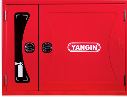
3- DEKORATİF SAC KAPAK / DECORATIVE SHEET COVER