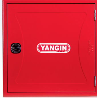
3- DEKORATİF SAC KAPAK DECORATIVE SHEET COVER