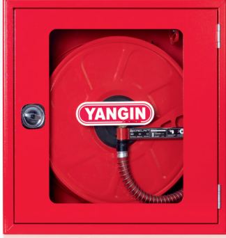
2- CAMLI KAPAK / GLASS COVER